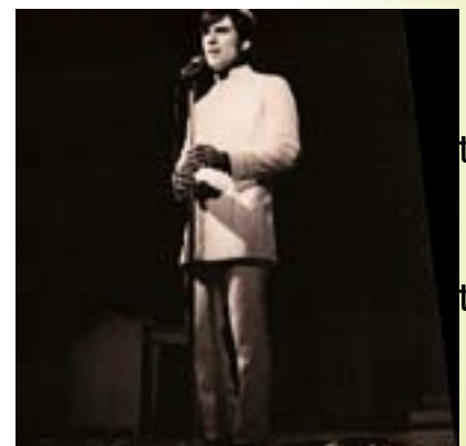
Uno de los tantos escenarios de Brazil donde comenzó a sentir los primeros grandes aplausos como cantante.