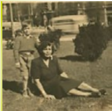
En Buenos Aires a la edad de cinco años, junto a su abuela materna.

al estilo de sus ídolos Elvis Presley y Bill Haley y sus Cometas. Fue tal la pasión, que de esa época data su primera experiencia en un estudio de grabación: a los once años juntó -con gran esfuerzo- unos ahorros para grabar en un acetato su voz imitando a Bill Haley. El acetato era un regalo para su madre.